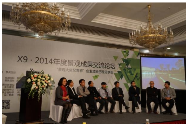
参与 2014 年景观成果交流论坛