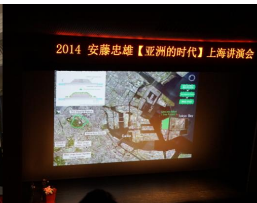
参与 2014 年安藤忠雄上海演讲