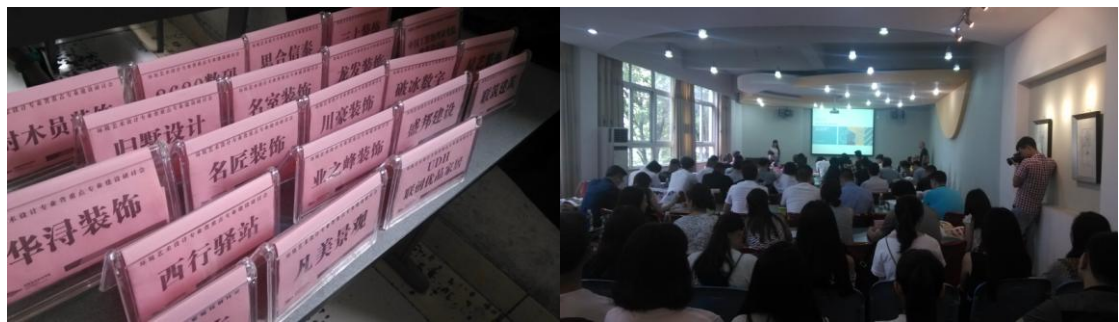
我院组织设计产业化背景下的高校教育模式探讨论坛