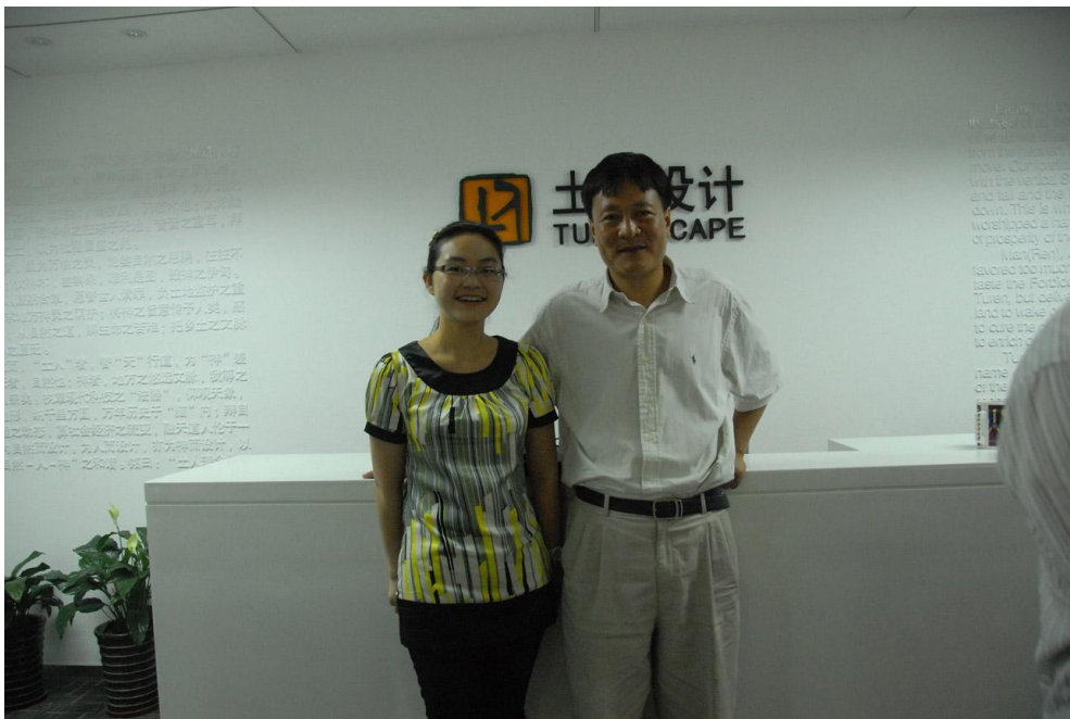
我院教师与俞孔坚教授进行交流